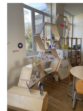
Le Pop Fab

Enzo, le conseiller numérique, vous recevra pour des ateliers plus spécifiques les samedis 10 et 17 février, à 10h30.